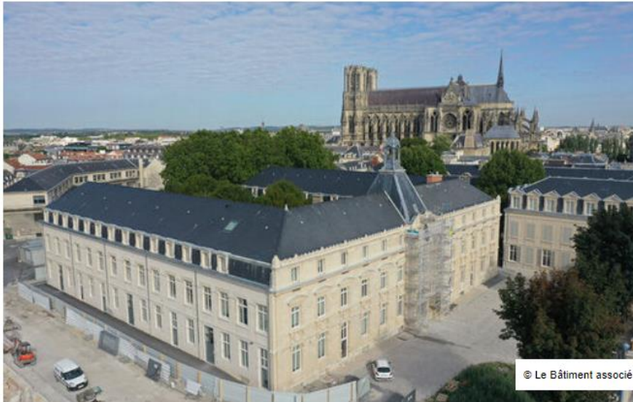
La reconstruction du collège « Université » au cœur de Reims conjugue le travail sur la pierre du XVI e siècle à celui du béton du XX e .