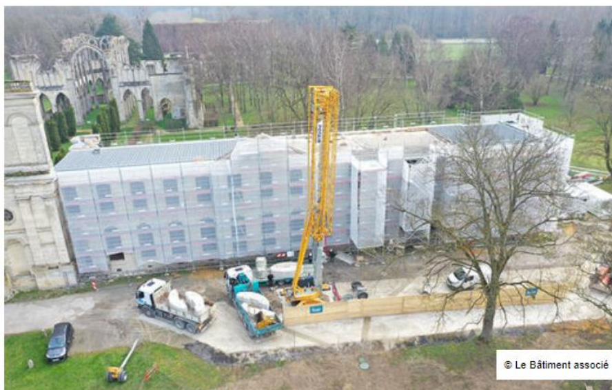
Le Bâtiment associé applique son savoir-faire en restauration de monuments historiques au chantier de l'imposante abbaye cistercienne d'Ourscamp (Oise).

La restauration de bâtiments patrimoniaux , classés monuments historiques ou non, a gagné en importance au fil du temps dans l'activité de la PME marnaise pour en représenter 15 % désormais (1) : les chantiers de la cathédrale de Soissons ( Aisne ), de l'abbaye d'Ourscamp (Oise) ou du Mémorial américain de Meaux en Seine-et-Marne , une statue en pierre de 20 mètres de haut, en constituent des références fortes actuelles ou récentes.